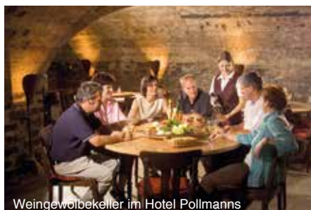
Weingewölbekeller im Hotel Pollmanns